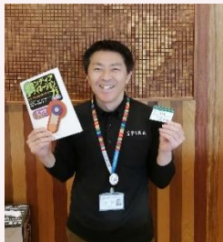
佐賀県国際交流協会

このボランティアコーディネーション力は、人と人との関わりではどこでも役に立つチカラだと感じています。(子育ても！) また、私自身を前に進めるチカラにもなっています！市民社会、共生社会に向けたみなさん自身の参加の力(の証)として、ぜひ受験されてはいかがでしょうか！！