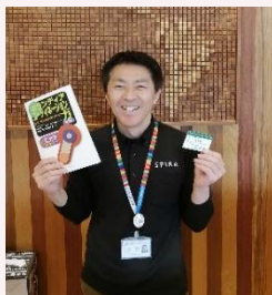
佐賀県国際交流協会

このボランティアコーディネーション力は、人と人との関わりではどこでも役に立つチカラだと感じています。（子育ても！）また、私自身を前に進めるチカラにもなっています！市民社会、共生社会に向けたみなさん自身の参加の力（の証）として、ぜひ受験されてはいかがでしょうか！！